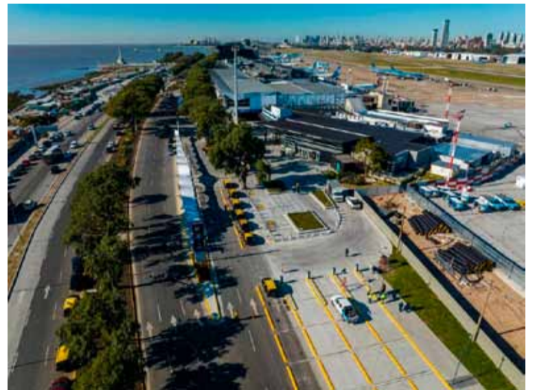
Aeroparque. El Jorge Newbery recibe prestigioso galardón

En el mismo sentido, se habilitaron las nuevas vialidades de ingreso al aeropuerto que permiten una circulación más eficiente de vehículos para la llegada de pasajeros y acompañantes.///