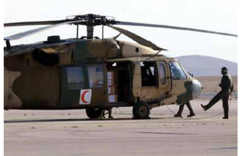
Jordania. Es un actor clave en el conflicto de Medio Oriente

El rey Abdalá II de Jordania reveló que se opuso al desplazamiento de palestinos en Gaza y Cisjordania durante una reunión que mantuvo en la Casa Blanca con el presidente de los Estados Unidos, Donald Trump, quien insistió en su pretensión de producir expulsiones para proceder a la reconstrucción, informaron medios internacionales. Tras el encuentro, del que también participó el secretario de Estado, Marco Rubio, Abdalá aseguró en X que reafirmó “la firme posición de Jordania contra el desplazamiento de palestinos en Gaza y Cisjordania”.