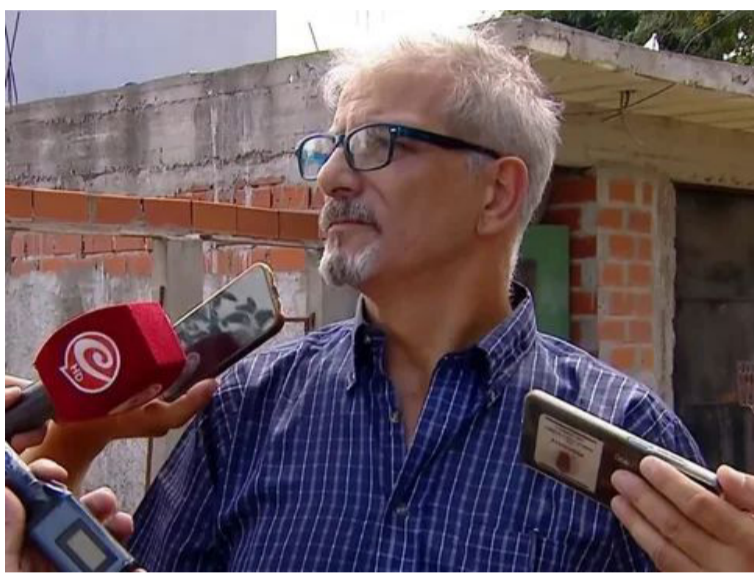
Padre de Paloma. Insiste con la hipótesis de ataque sexual

"Hace poco me largo a llorar cuando me mostraban las