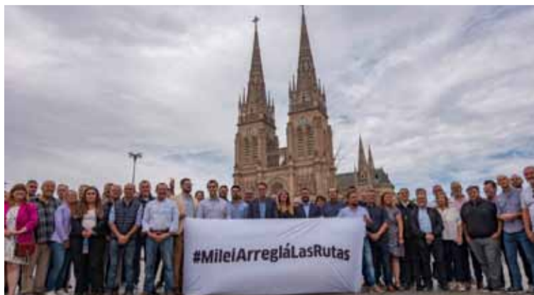
El ministro Katopodis junto a intendentes, en La Plata, con el reclamo al gobierno nacional

En la demanda se pide a la justicia que le ordene al gobierno nacional que reinicie las obras pero además se requiere información sobre el destino final de los fondos (200 mil millones que recaudó con el Impuesto a los