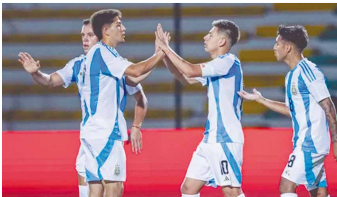
La Selección ya venció holgadamente a su par de Brasil en la primera fase

La Albiceleste llega invicta a este encuentro y con el antecedente de haber goleado a su rival por 6-0 en el certamen