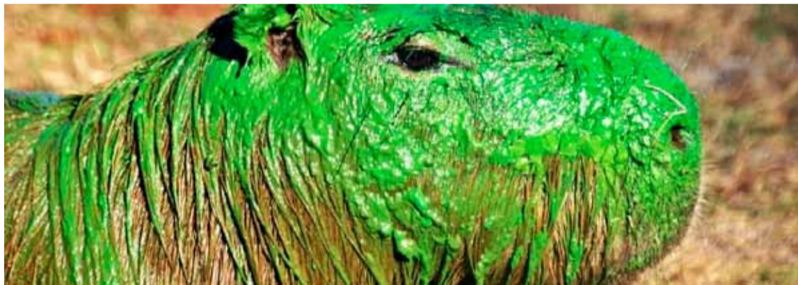
Carpinchos. Aparecen teñidos de verde en Entre Ríos

Varios carpinchos aparecieron teñidos de verde en la provincia de Entre Ríos y hubo alarma sobre el extraño hallazgo que se viralizó, principalmente en redes sociales.