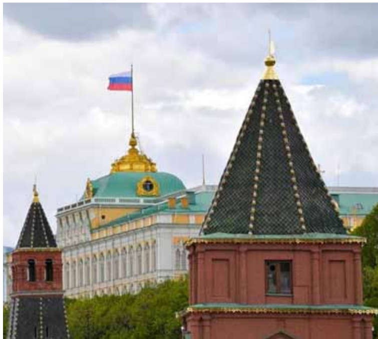
Moscú. Niega discusión sobre intercambio de territorios

Los comentarios fueron pronunciados a raíz de las declaraciones recientes del presidente de Ucrania, Volodimir Zelenski, de que planea proponer a Rusia un intercambio directo de territorio si el presidente estadounidense, Donald Trump, consigue reunir a Kiev y Moscú en la mesa de negociaciones. El martes, Trump anticipó que enviaría al secretario del Tesoro estadounidense, Scott Bessent,