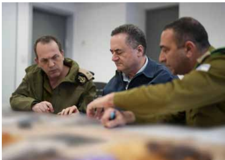
Firme posición. Del ministro de Defensa israelí, Israel Katz

Así parafraseó el ministro al magnate, quien amenazó el lunes con que se desate «el infierno» en Gaza después de que Hamás