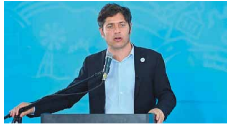
Kicillof criticó el proyecto

El gobernador de la provincia de Buenos Aires, Axel Kicillof, cuestionó el proyecto de ley Ficha Limpia, al considerarlo un intento de "persecución y proscripción" contra la ex presidenta Cristina Kirchner.