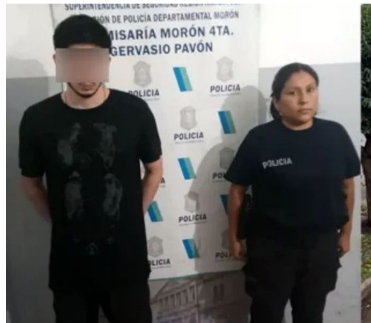
Detenido. El nieto que mató a su abuela

Un joven de 27 años asesinó a su abuela de 87 tras una discusión, en la cual la jubilada fue estrangulada hasta causar la muerte.